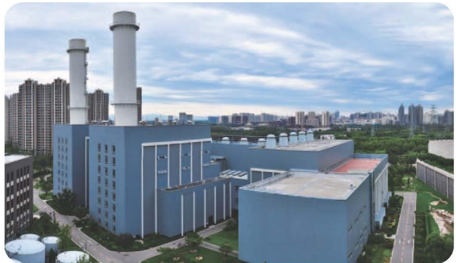
北京太阳宫燃气热电厂图